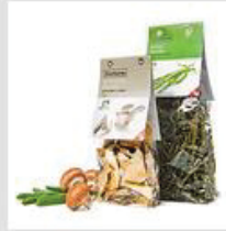
Trockengemüse / Trockenpilze