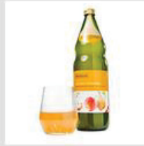
Getränke ohne Alkohol