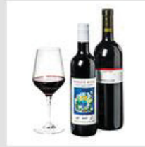
Getränke mit Alkohol