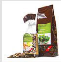
Öl- und Keimseen