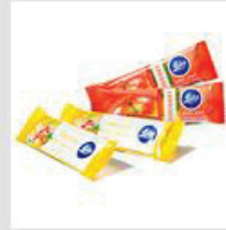
Riegel / Knabbereien