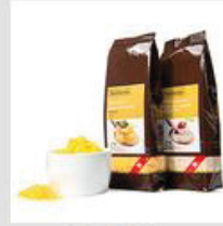
Schrot / Griess