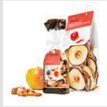
Trockenfrüchte / Nüsse / Kerne