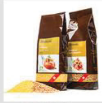
Getreide / Körner