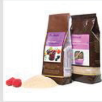
Zucker / Gellierzucker (Unigel)