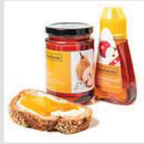
Brotaufstriche / Honig