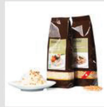
Reis und Risotto