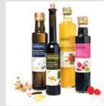
Öl und Essig