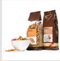
Müesli / Flocken